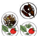
Larve de cétoine