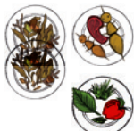
Chenille de papillon