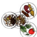
Larve de hanneton