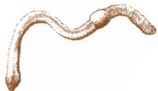
Lombric "ver de terre"