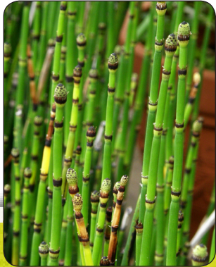
Tiges fertiles de printemps