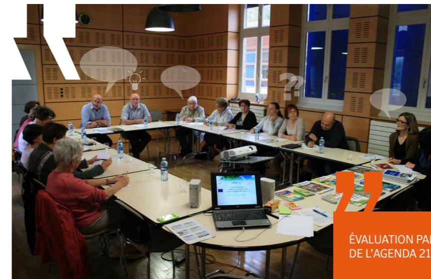
ÉVALUATION PARTICIPATIVE D'UNE ACTION DE L'AGENDA 21 LOCAL DE SANCÉ (71)

*Participation, organisation du pilotage, transversalité des approches, évaluation partagée, stratégie d'amélioration continue